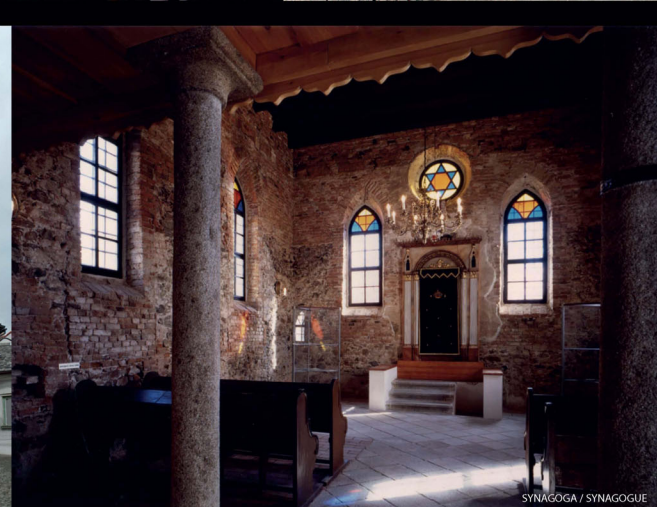
SYNAGOGA / SYNAGOGUE