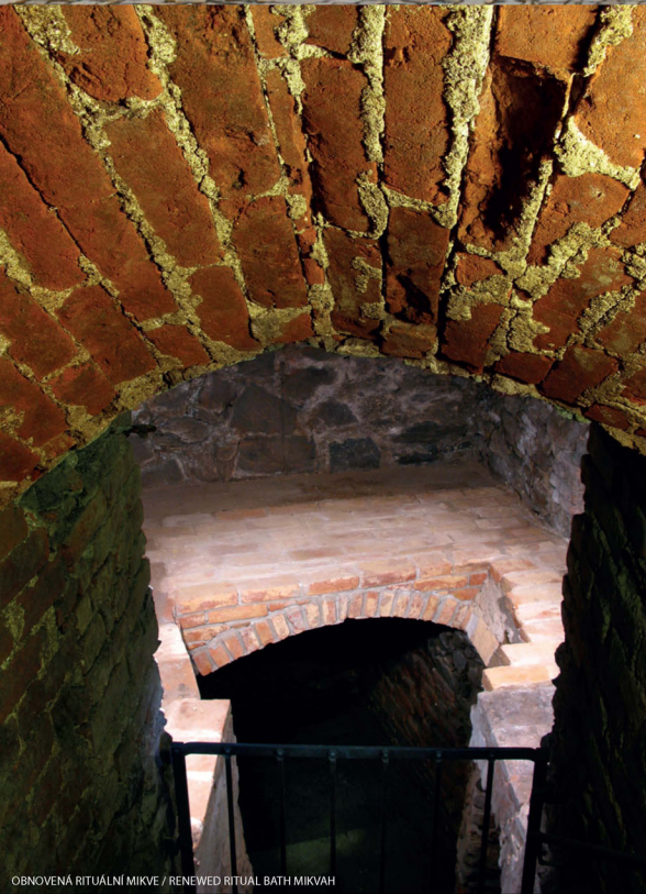
OBNOVENÁ RITUÁLNÍ MIKVE / RENEWED RITUAL BATH MIKVAH