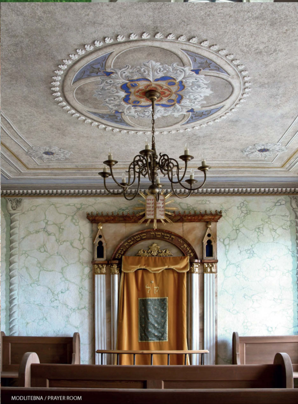
MODLITEBNA / PRAYER ROOM