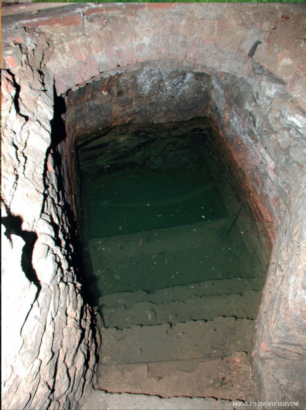
MIKVE PO ZNOVUOŽIVENÍ